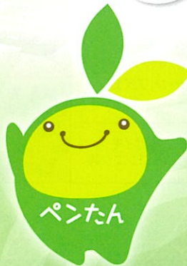
オリジナルキャラクター“ペンたん” 商標登録済