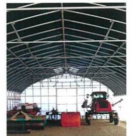
屋根：涼香 サイド：真白 ハウス使用例